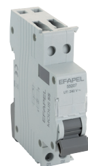
bobinas de disparo