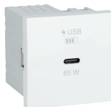
carregador USB C Power Delivery (30 W, 45 W e 65 W)