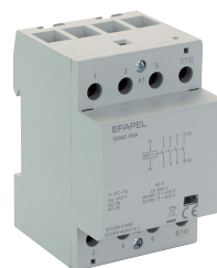
contactores 40 A