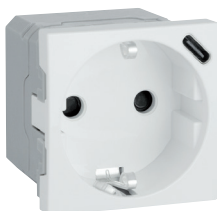
tomada schuko com carregador USB C