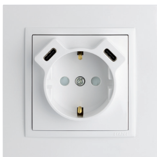
tomada schuko com carregador USB C+C