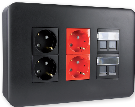
Postos de Trabalho