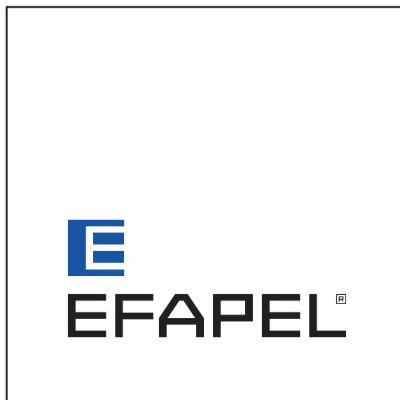
Tabela de Preços 2023-05-02